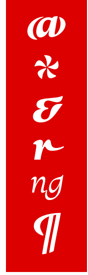
Monarcha es una familia de fuentes serifadas, para texto extenso y lectura decansada.

čh ck cl ct ee gg gi gm gn gr gu gy il ik ib ly ng oo ph pp ry sb sf sh sk sp st th Th tt